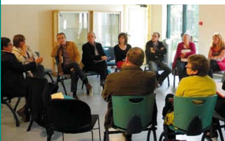
Réunion d'information sur les cigales à Wimille.