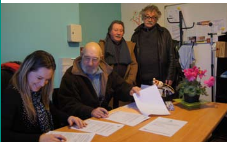
Signature entre Baby Coccinelle et les clubs Sud Avesnois et Helves et Sambre.