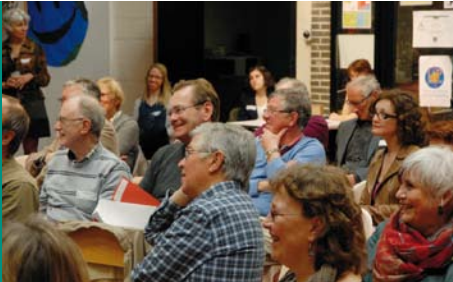
Assemblée générale de l'Association des cigales le 12 avril 2014.