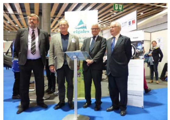
Renouvellement de la convention et élargissement aux 3 BGE lors du Salon « Créer » de septembre 2015

40 participations aux comités ou jurys de 8 partenaires ont été comptabilisées pour 2015.